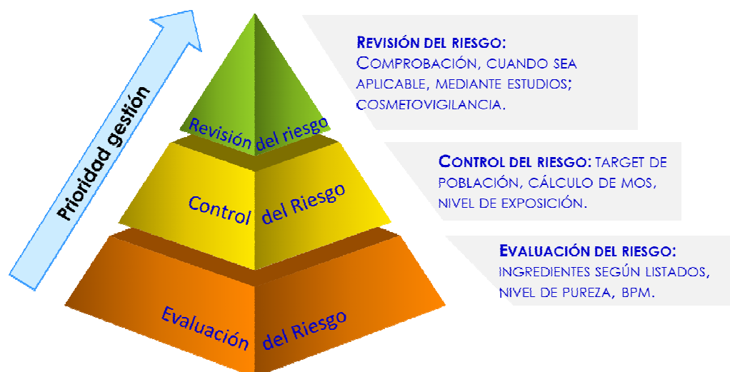
Figura 1. Prioridad en la gestión de la seguridad en cosméticos

La prioridad de la gestión de los riesgos en cosméticos se detalla en la figura 1. Allí se destacan algunos de los aspectos antes citados como la importancia de la aplicación y cumplimiento de las Buenas Prácticas de Fabricación (BPF), la selección adecuada de los ingredientes y la población a la cual está dirigido el producto.