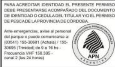
FIGURA N° 2: Formulario de formato digital