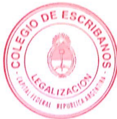
VIOLETA NIROS COLEGIO DE ESCRIBANOS CONSEJERA