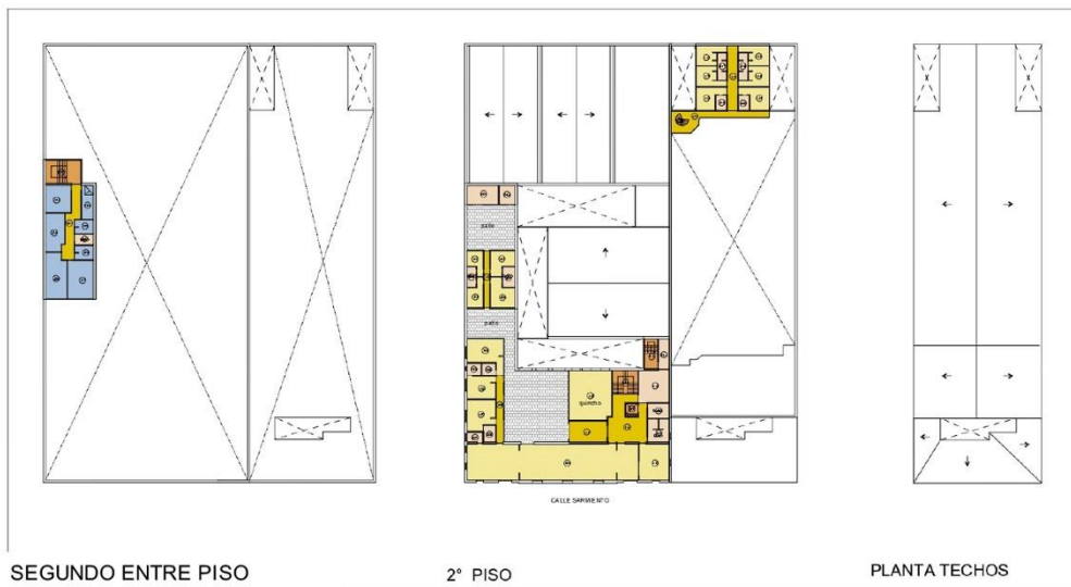
SEGUNDO ENTRE PISO