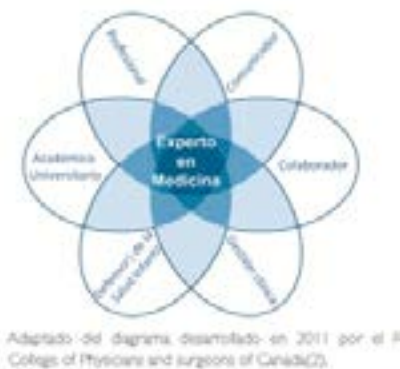
Figura 1. Interrelación entre las distintas competencias, donde la de Experto en Medicina es fundamental.

El pediatra posee un cuerpo de conocimiento específico que conforman un conjunto de habilidades y competencias que son usadas para recabar e interpretar datos, realizar decisiones clínicas apropiadas y realizar las conductas diagnósticas y terapéuticas de la especialidad. Se caracteriza por dar un cuidado clínico actualizado, ético y costo efectivo. Este rol de experto de medicina es central en la práctica pediátrica y es el fundamento donde se apoyan los otros roles de comunicador, colaborador, administrador, defensor de la salud infantil, docente y profesional ( figura 1 ). En este rol, el residente demostrará habilidades preventivas, diagnósticas, terapéuticas y pronósticas para un cuidado eficiente y ético del paciente pediátrico.