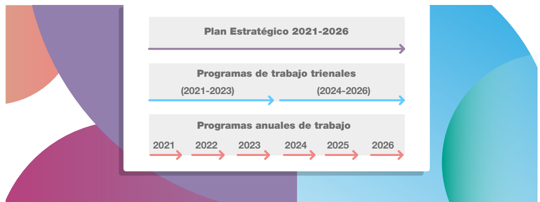
Gráfico 1. Ciclo de planificación estratégica en el ámbito del INDEC

Así, la implementación de los objetivos estratégicos en proyectos, actividades y tareas se realiza mediante la ejecución de los diferentes programas de trabajo. Una vez que el INDEC define, promueve y monitorea sus perspectivas estratégicas, estas se traducen en objetivos, proyectos y actividades a nivel de cada una de las áreas que componen la estructura organizativa vigente 4 , de modo tal que puedan cumplir con sus respectivas misiones, funciones y responsabilidades primarias.