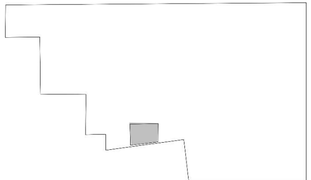
PLANO BAULERA 9 - SS