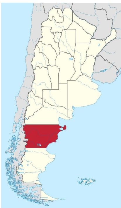
Provincia de Chubut