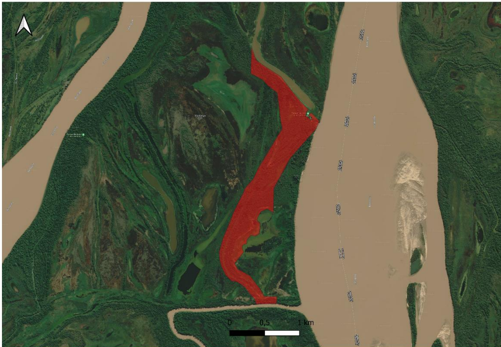
Vista de la Isla El Rico

a pesar de ser inundables, quedan libres, en su mayoría, de anegamientos hasta crecidas de 5 metros aproximadamente.