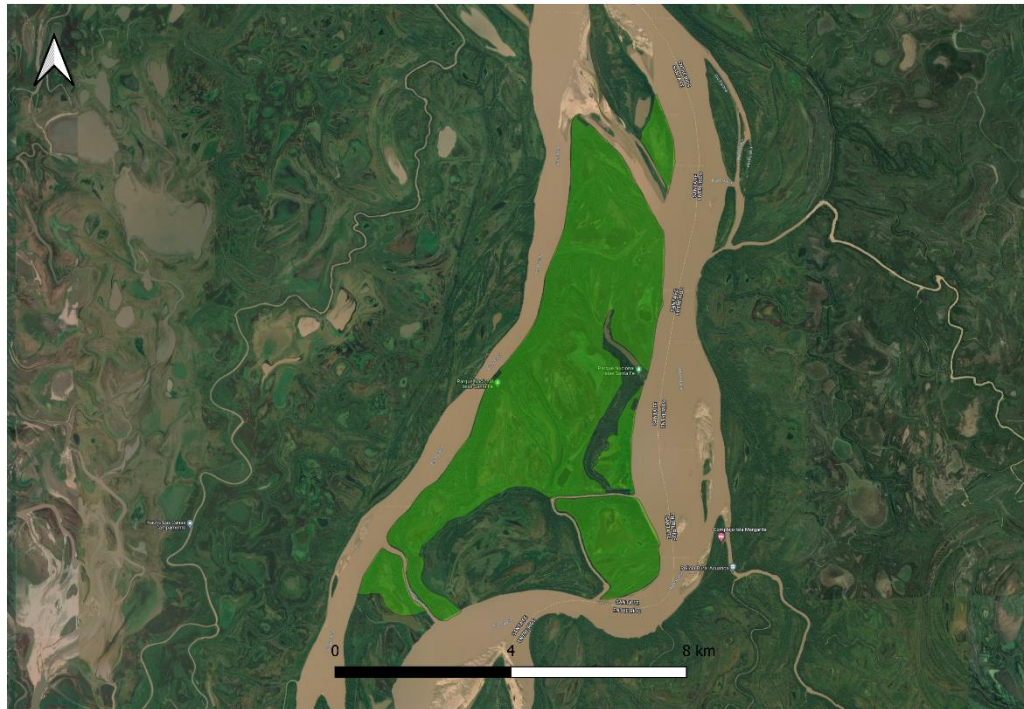
Vista completa del PNISF