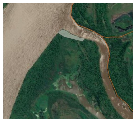
Vista de la isla El Lago