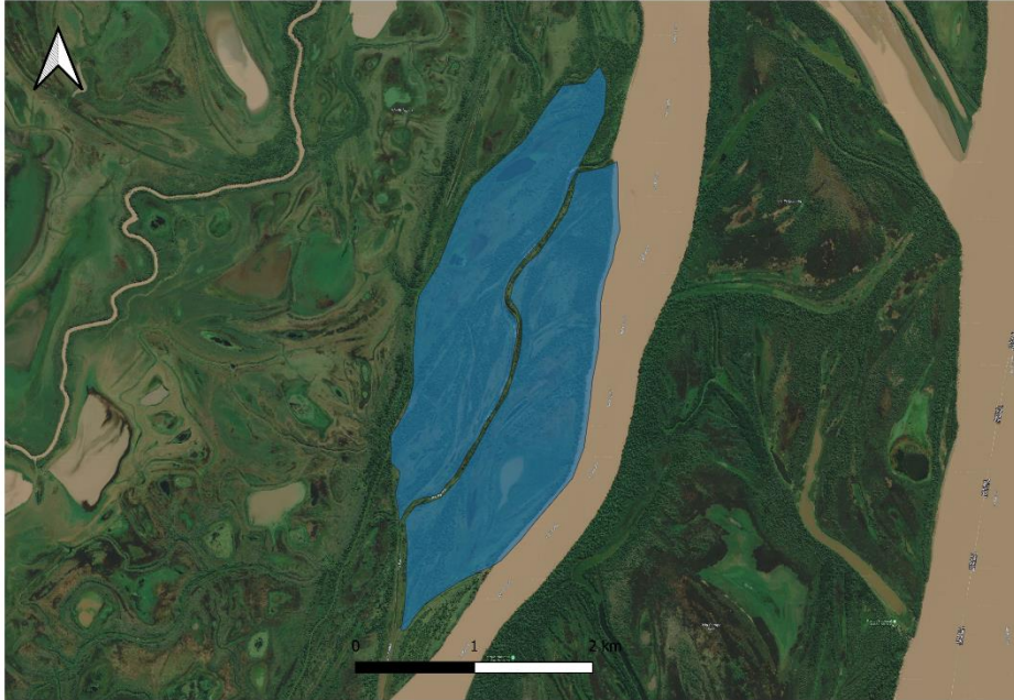
Vista de las Islas La Mabel y El Alisillar

Informe técnico de la Coordinación de Pobladores y Comunidades IF-2021-123905586-APN-DNC#APNAC y el Informe técnico del PNISF IF-2022-46373063-APN-PNISF#APNAC. Desde la fecha de creación del Parque Nacional hasta una década después, la APN llevó adelante una política de desalojos de las poblaciones que habitaban en las islas. Sin embargo, los desalojos de estas dos familias no se produjeron debido a sus propias estrategias de resistencia.