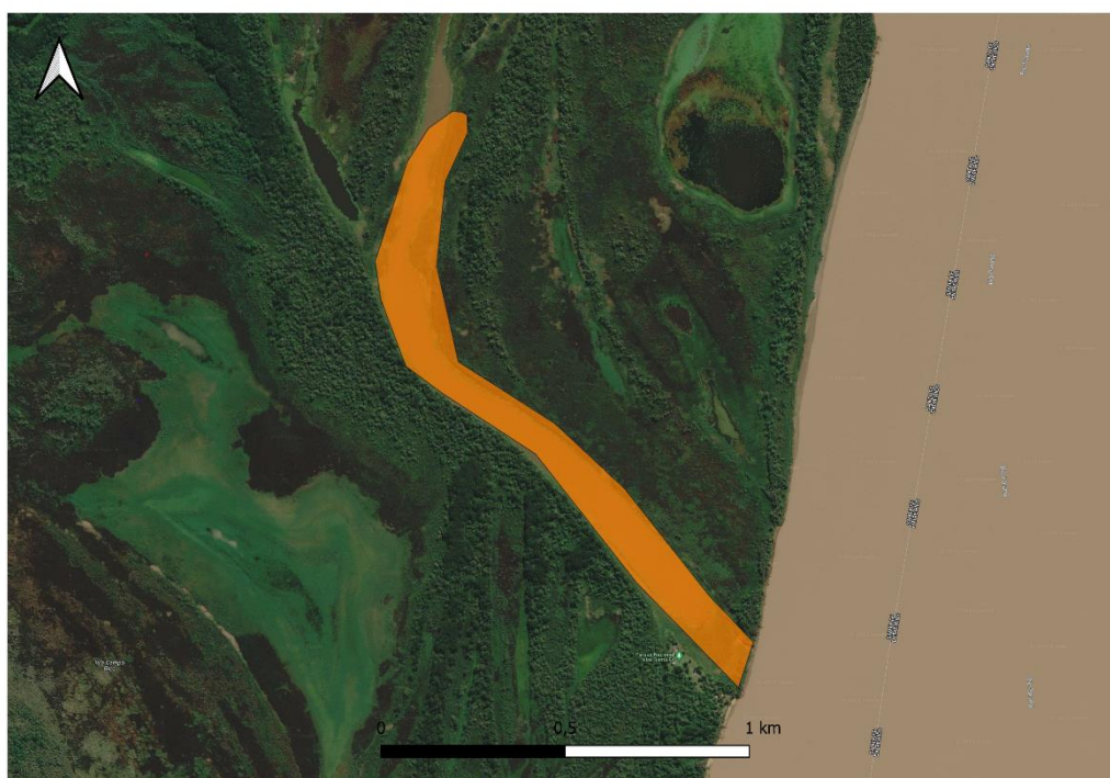
Vista de las Islas El Rico y El Conscripto