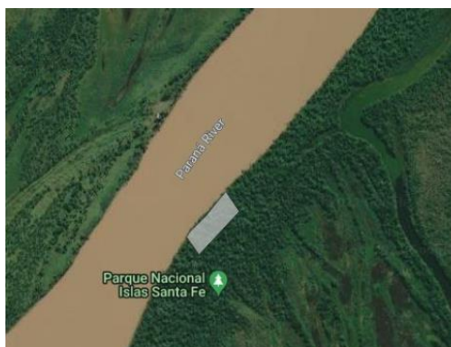
Vista de la isla El Rico (Paraná de los Reyes)