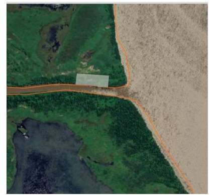
Vista de la Isla El Rico (La Victoria)