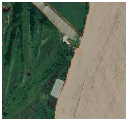
Vista de la Isla El Rico (Eucaliptal)